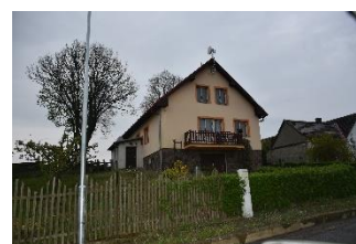
chráněné bydlení Svatava