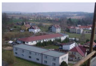
Obecní úřad Lidmaň