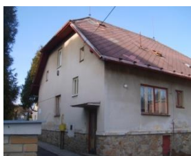
chráněné bydlení Černovice