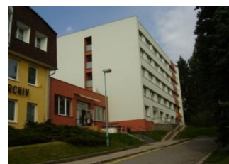
chráněné bydlení Pelhřimov