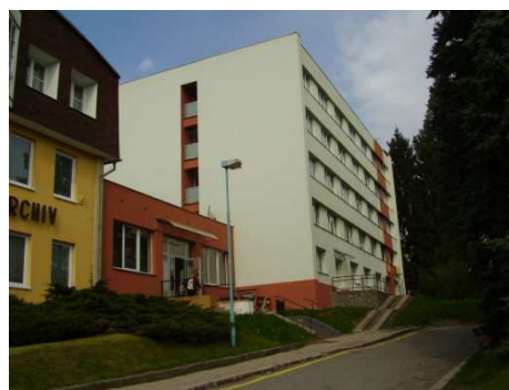
chráněné bydlení Pelhřimov