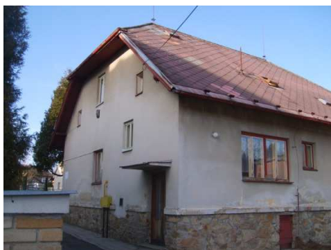
Chráněné bydlení Černovice