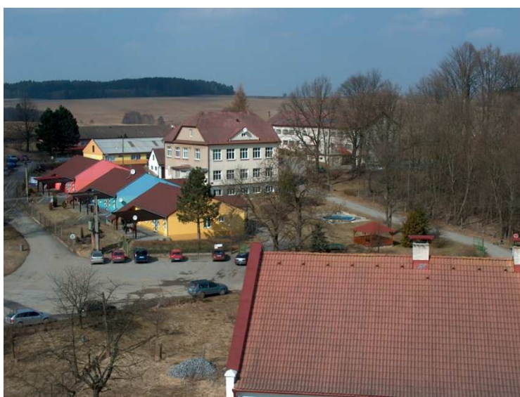
Domov pro osoby se zdravotním postižením Lidmaň