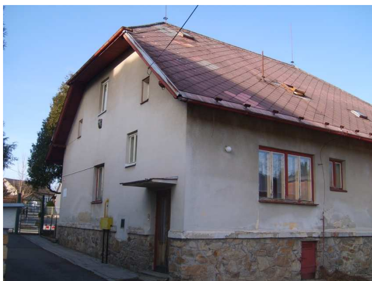
Chráněné bydlení Černovice